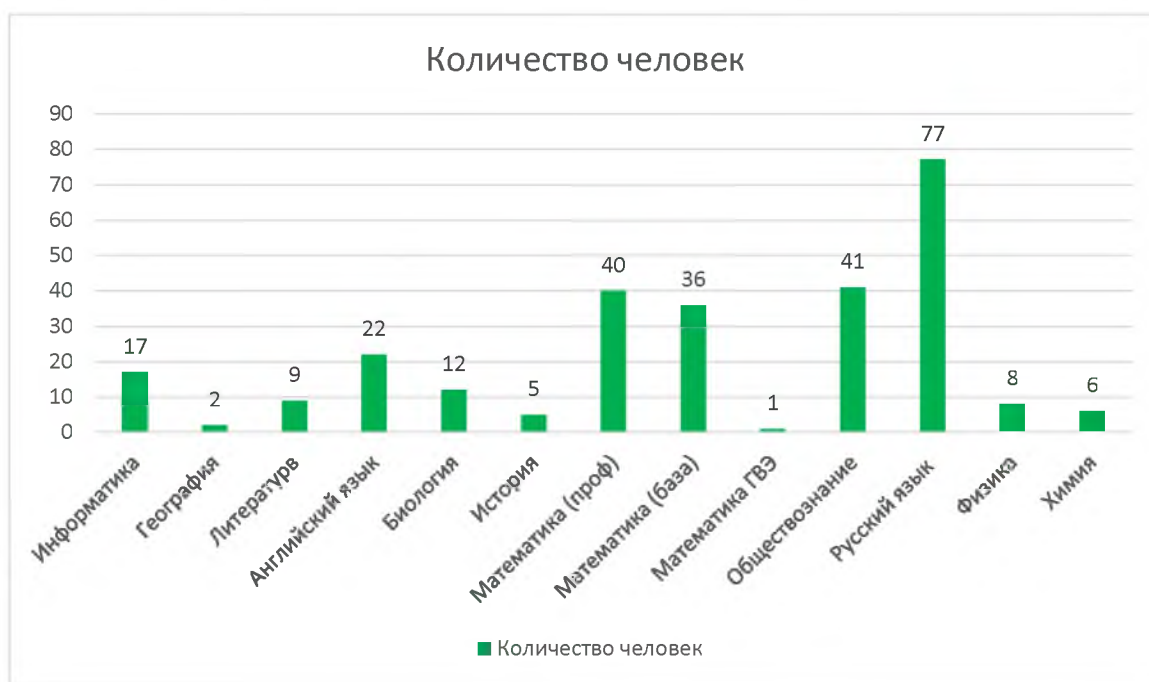
Диаграмма выбора предметов выпускниками 11 классов показывает:

Количество выбранных экзаменов обучающимися